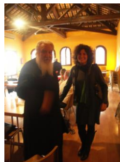
ILUSTRACIÓN 21 ALGUNOS LÍDERES RELIGIOSOS