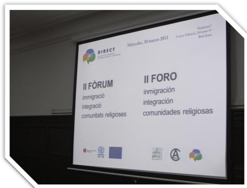
ILUSTRACIÓN 1 PANEL INAUGURAL Y PUBLICITARIO DEL FORO

El pasado 30 de marzo de 2011 se celebró el II Foro sobre Inmigración y Comunidades Religiosas, una iniciativa que se enmarca en la promoción del pluralismo religioso. Fue organizado conjuntamente por la Asociación Círculo Africano y el Grupo de Trabajo Estable de Religiones (GTER) cofinanciada por la UE y la Fundación Pluralismo y Convivencia (FPyC).