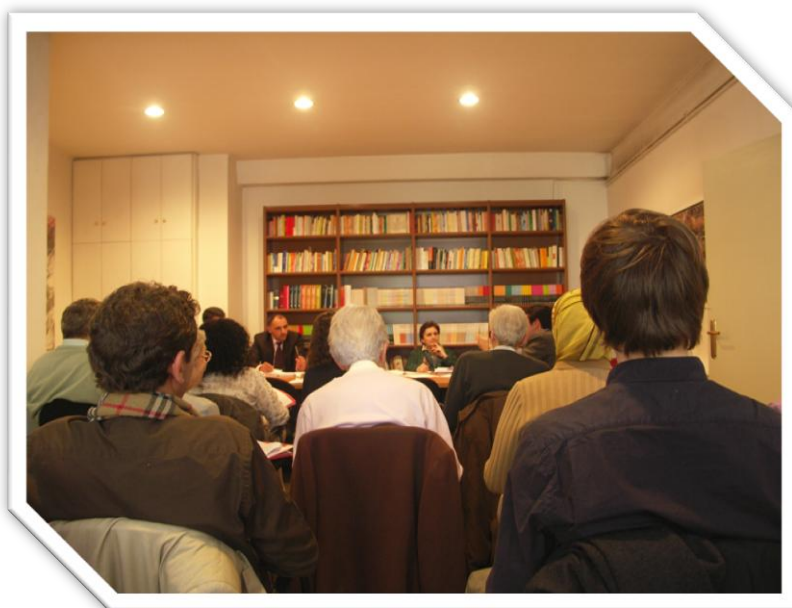
ILUSTRACIÓN 7 IMÁGEN DEL GRUPO DE TRABAJO I