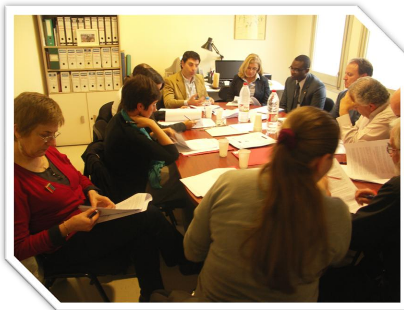
ILUSTRACIÓN 8 IMÁGEN DEL GRUPO DE TRABAJO II.