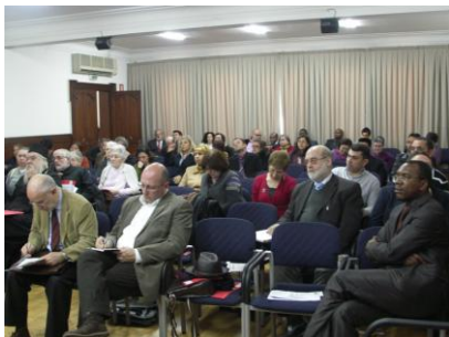
ILUSTRACIÓN 14 ASISTENTES A LAS MESAS REDONDAS