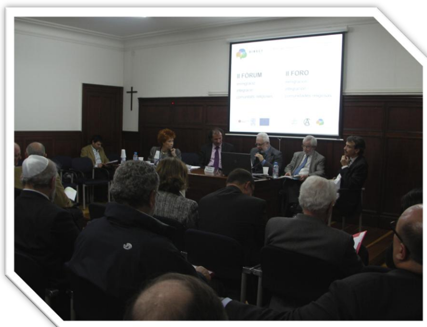
ILUSTRACIÓN 3 PRIMERA MESA REDONDA Y PONENCIAS "CATALUÑA, INMIGRACIÓN, Y COMUNIDADES RELIGIOSAS"