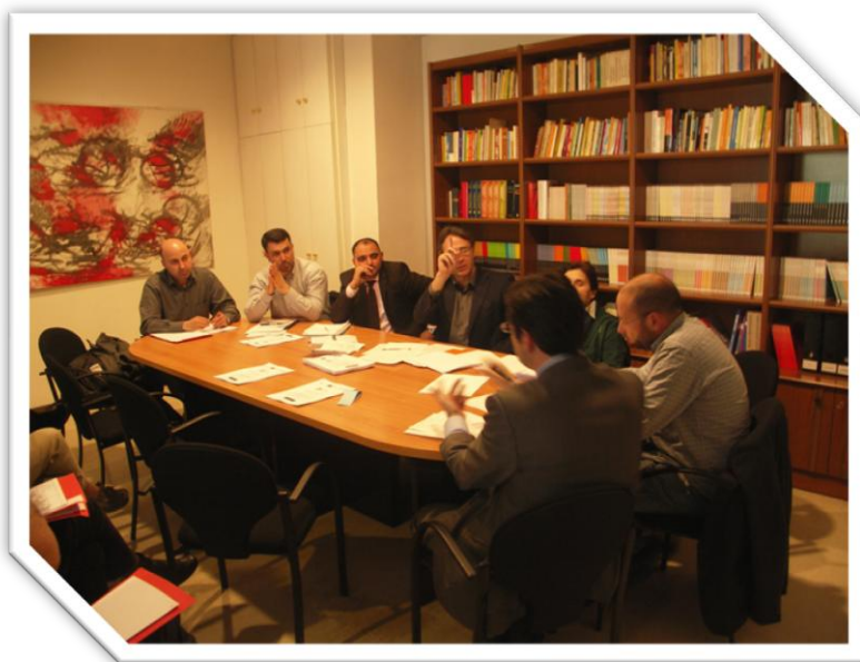
ILUSTRACIÓN 6 IMÁGEN DEL GRUPO DE TRABAJO I