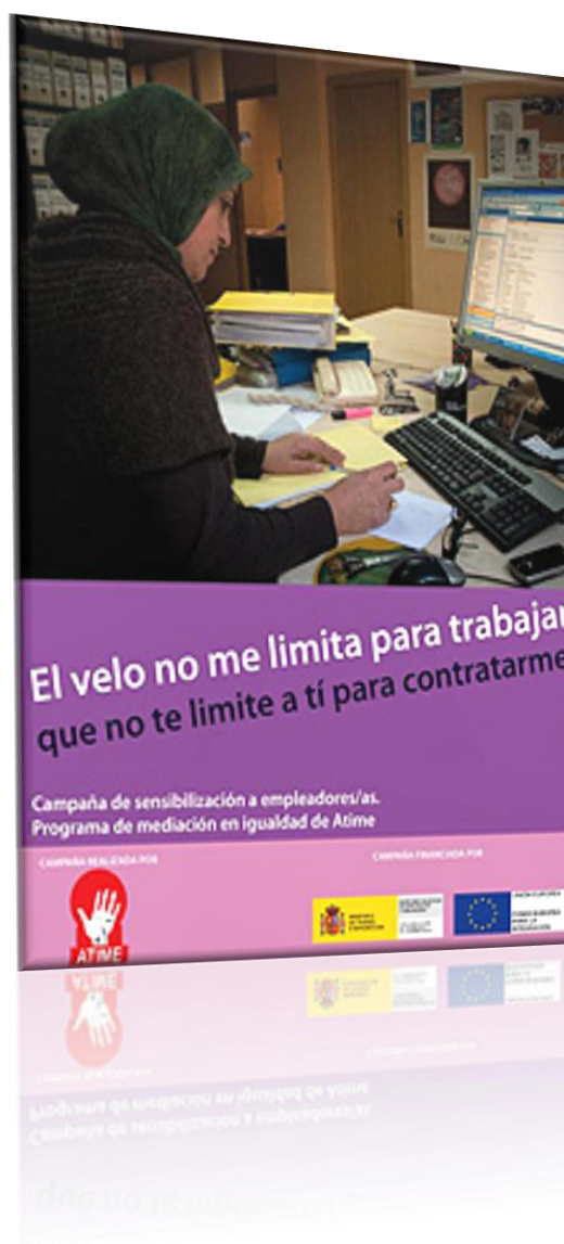
ILUSTRACIÓN 10 CAMPAÑA POR LA INTEGRACIÓN LABORAL A TRAVÉS DE LA MEDIACIÓN, COMO EJEMPLO DE BUENAS PRÁCTICAS DEL MUNICIPIO EN COLABORACIÓN CON ENTIDADES RELIGIOSAS Y ASOCIACIONES DE INMIGRANTES

Por otra parte, los problemas de interlocución que se percibían desde el momento en que las jerarquías se encontraban ciertamente desdibujadas, surgiendo corrientes distintas en una “diversidad en la diversidad”, generando conflictos internos que, finalmente sólo derivan de orígenes diferentes. Los Equipos de Mediación Ciudadana destinaron un trabajador casi en exclusiva en las relaciones con las Comunidades Religiosas, con un resultado muy favorable.