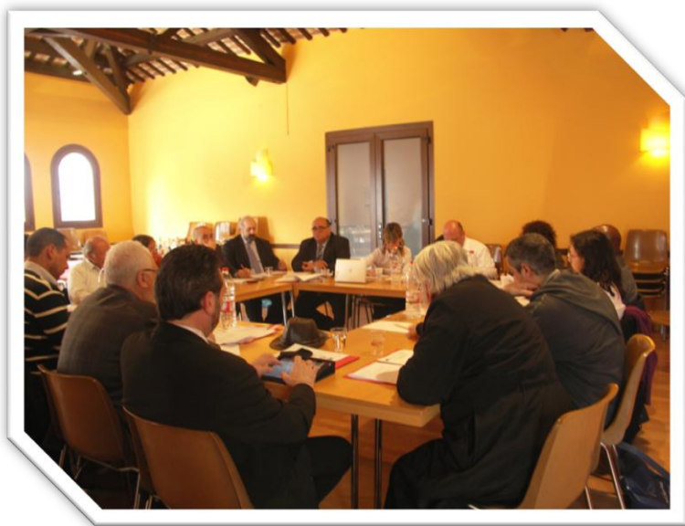
ILUSTRACIÓN 12 IMAGEN DEL GRUPO DE TRABAJO III. PRIMERA PARTE DE LA SESIÓN.