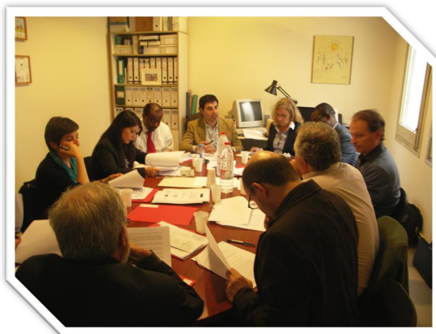
ILUSTRACIÓN 9 IMÁGEN DEL GRUPO DE TRABAJO II