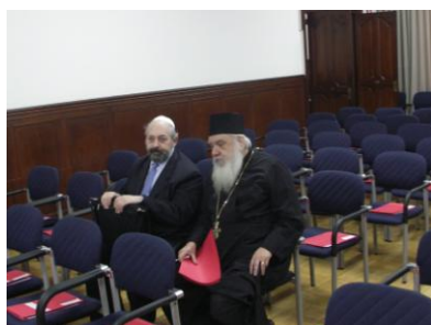
ILUSTRACIÓN 20 LÍDERES RELIGIOS Y REPRESENTANTES DE LAS ENTIDADES LOCALES