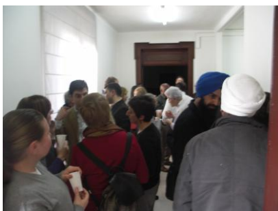
ILUSTRACIÓN 18 ORGANIZACIÓN PAUSA-CAFÉ