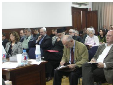
ILUSTRACIÓN 15 ASISTENTES A LAS MESAS REDONDAS