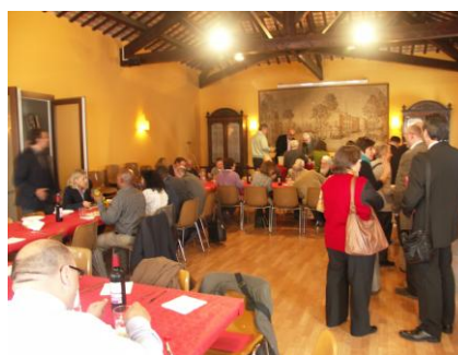
ILUSTRACIÓN 17 ASISTENTES A LAS MESAS REDONDAS