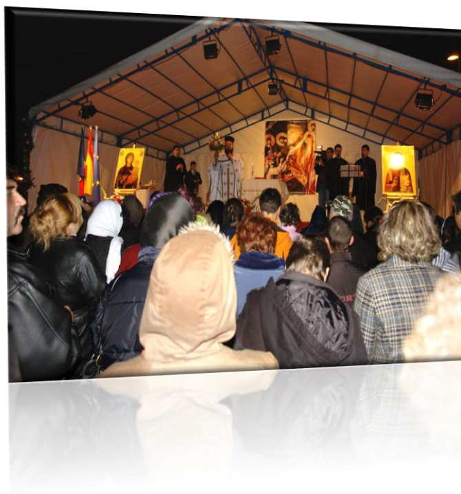
ILUSTRACIÓN 11 MISA DE PASCUA ORGANIZADA POR LA IGLESIA ORTODOXA RUMANA DEL MUNICIPIO DE COSLADA, EN COLABORACIÓN CON LA CONCEJALÍA DE INMIGRACIÓN DEL

La reducción del 70% del presupuesto de integración de las Comunidades Autónomas se percibe en el municipio como un factor que pudiera dificultar las potenciales actuaciones.