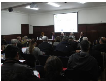
ILUSTRACIÓN 16 ALMUERZO DE TRABAJO