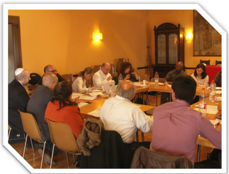
ILUSTRACIÓN 13 IMAGEN DEL GRUPO DE TRABAJO III